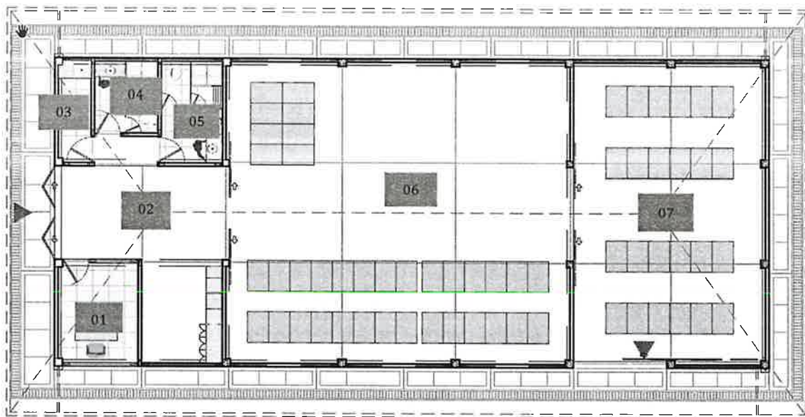
Imagen 1: Se muestra la planta de distribución arquitectónica

"Año de la unidad, la paz y el desarrollo"