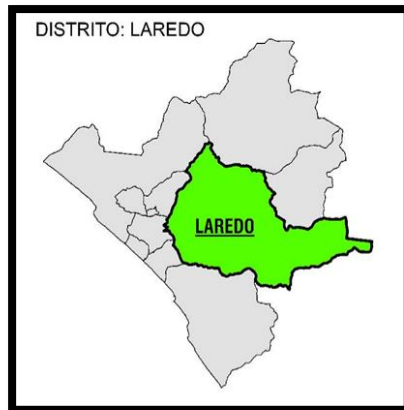
IMAGEN N°3 y N°4:

Mapa del Departamento de La Libertad y Provincia de Trujillo con sus distritos.