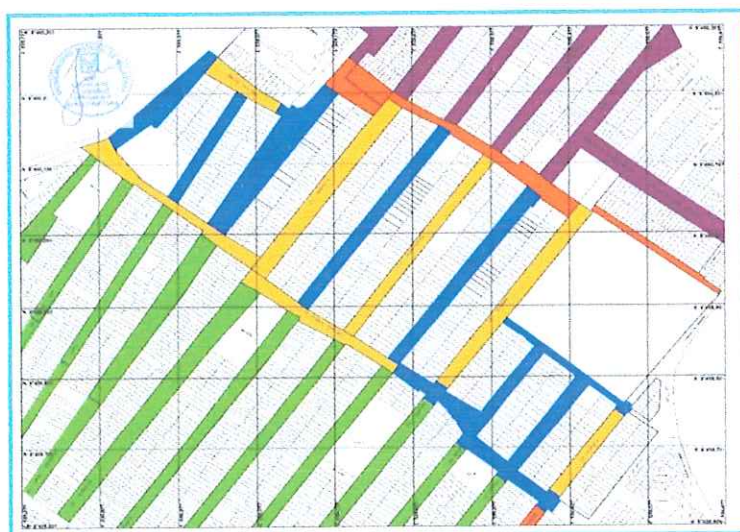
Gráfico 02: Localización del proyecto Elaboración propia