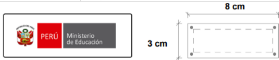
Esquema referencial de placa de logotipo institucional con medidas y ubicación de remaches

Bloques Básicos, Bloques Complementarios, Conectores, Bienes de Espacio Público y Sistema Complementario: Deberá corresponder con lo señalado en los Anexos B, C, D y E, especialidad de arquitectura. Asimismo, será incluido por el Contratista en la "Etapa de Informes de Muestras, Ingenierías, Diseño de Mezclas y Plan de Seguridad". Pararrayos incluido en Sistema Complementario: Será propuesto por el Contratista en la "Etapa de Informes de Muestras, Ingenierías, Diseño de Mezclas y Plan de Seguridad".