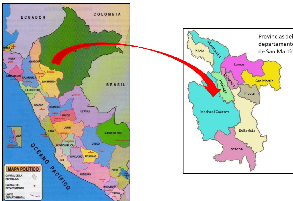
IMAGEN N° 1: UBICACIÓN REGIONAL Y PROVINCIAL