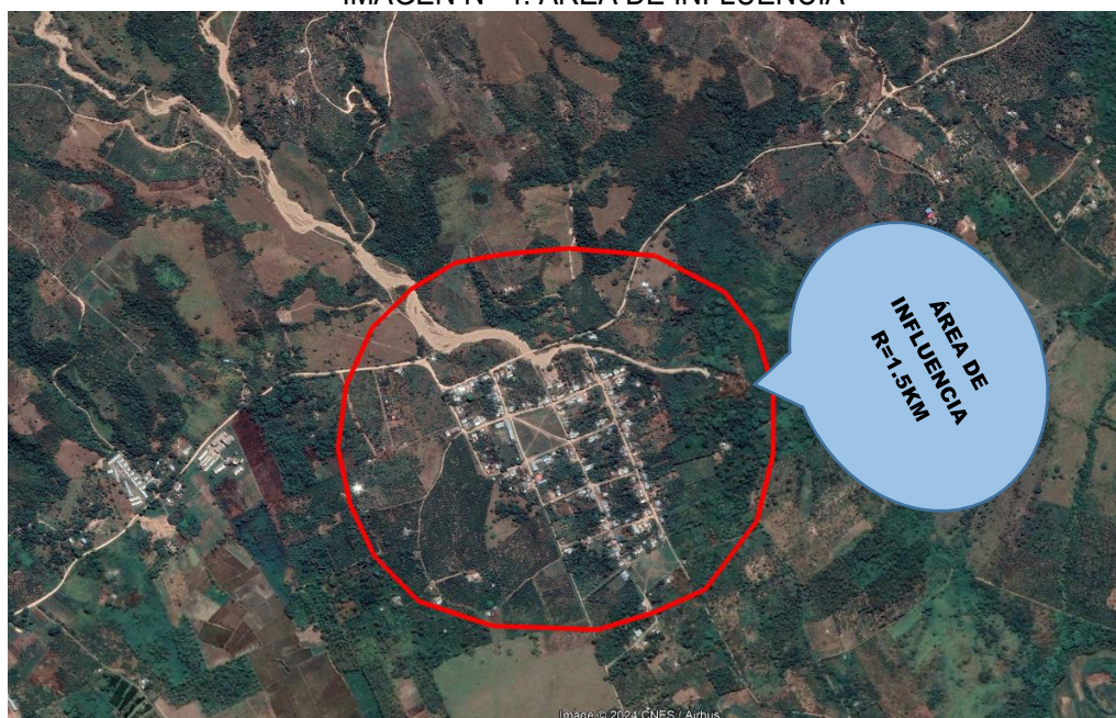
IMAGEN N° 4: ÁREA DE INFLUENCIA