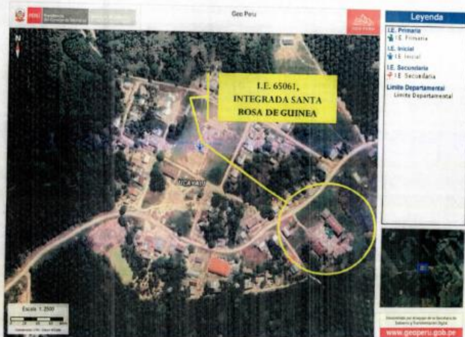
Ilustración 1. Vista Satelital de la Ubicación de la IE Integrada en el Centro Poblado Santa Rosa de Guinea del Distrito de Neshuya