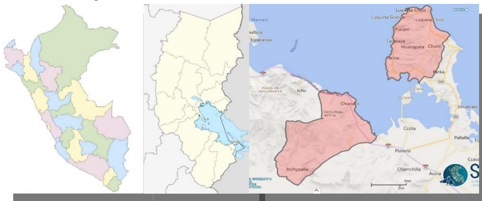
Figura 1. Macro Localización del Área de estudio.