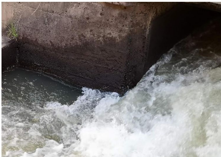
Imagen 02: Vista de flujo turbulento de agua en canal de descarga exterior, que provocan pérdida de superficie de concreto.