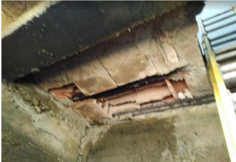
Imagen 11: Zonas de pérdida de superficie de recubrimiento de concreto.

Generando Energía con Responsabilidad Social