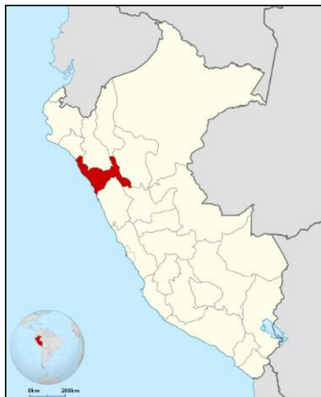
Ilustración 2: Ubicación de la Provincia de Pataz en el Departamento de La Libertad.

Ilustración 1: Ubicación del Departamento de La Libertad en el Mapa del Perú.