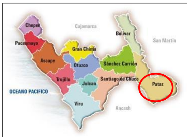
Ilustración 3: Ubicación del Distrito de Parcoy en la Provincia de Pataz.