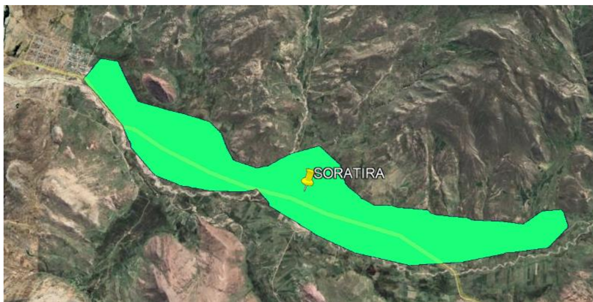
Figura N°03 Área de influencia del estudio