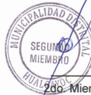
2do. Miembro suplente