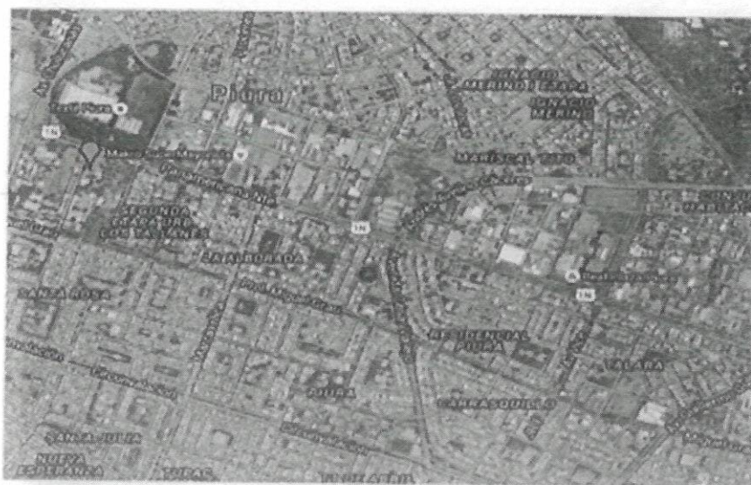
Vista satelital de la I.E. Jesús Nazareno – A.A.H.H Santa Rosa

"Año del Bicentenario, de la consolidación de nuestra independencia, y de la conmemoración de las heroicas batallas de Junín y Ayacucho" "Decenio de Igualdad de oportunidades para mujeres y hombres"