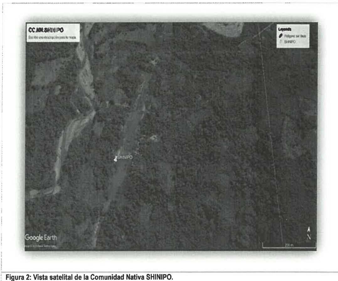
Figura 2: Vista satelital de la Comunidad Nativa SHINIPO.