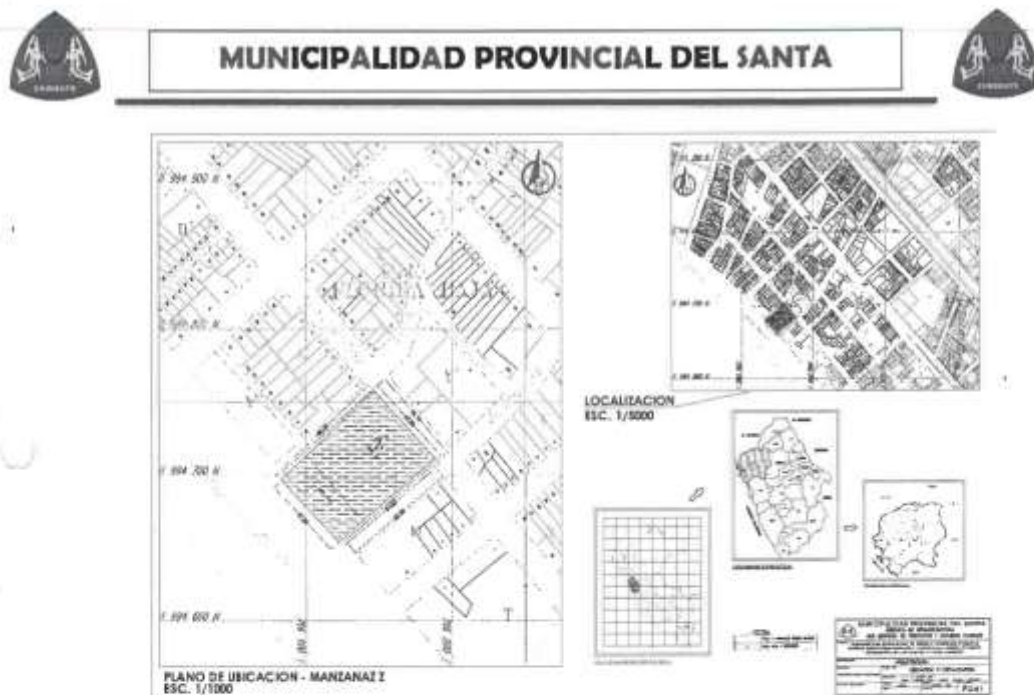
Imagen N.º 01: Plano de Ubicación del Complejo Deportivo.