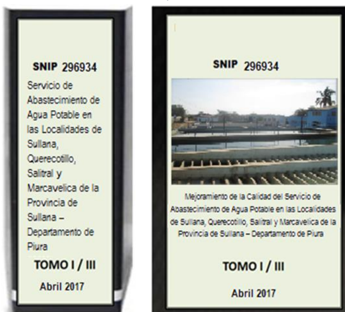
Ilustración 1: Modelo de Presentación del Expediente Técnico

La versión digital deberá ser grabada en 01 DVD y anexada al Expediente Técnico, el cual estará grabada en versión PDF (el documento con todas las firmas respectivas) y en versión editable (Word).