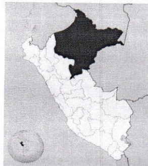
FIG. N°01: MACROLOCALIZACION DEL PROYECTO

La presente adquisición de seis (06) Grupos Electrógenos tiene como finalidad pública la generación de energía eléctrica, presenta necesidades básicas que no se encuentran cubiertas y que afectan a la población; y una de esas necesidades es la energía eléctrica. Con la adquisición del Generador Eléctrico para la Central Térmica, favorecemos a muchas familias en la comodidad y tranquilidad dotándoles de una fuente de generación de energía eléctrica en las viviendas de las localidades, para un futuro mejor en nuestro departamento.