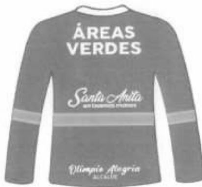
Polo manga larga cuello redondo Espalda