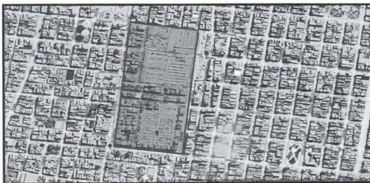
Área de influencia del proyecto.