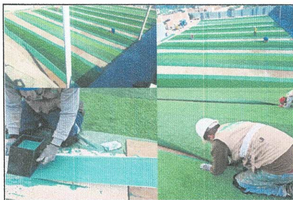
Imagen Referencial De Unión de los Paños

También este relleno especialmente la arena le brinda peso al Grass. Asu vez, contribuirá a retener la humedad y se prolongará la sensación de frescura necesaria durante los meses de verano o días de intenso calor