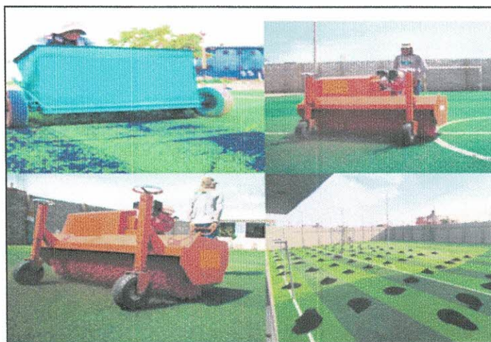
Imagen Referencial Del Extendido del Caucho

Se verterá sobre el césped, a razón de 5 Kg por metro cuadrado, se debe cepillar pacientemente en dirección contraria a las fibras, de manera que vaya bajando hasta el fondo y forme una capa que una el terreno y el césped. El proceso del cepillado puede hacerse con un cepillo plástico de cerdas duras o uno eléctrico.