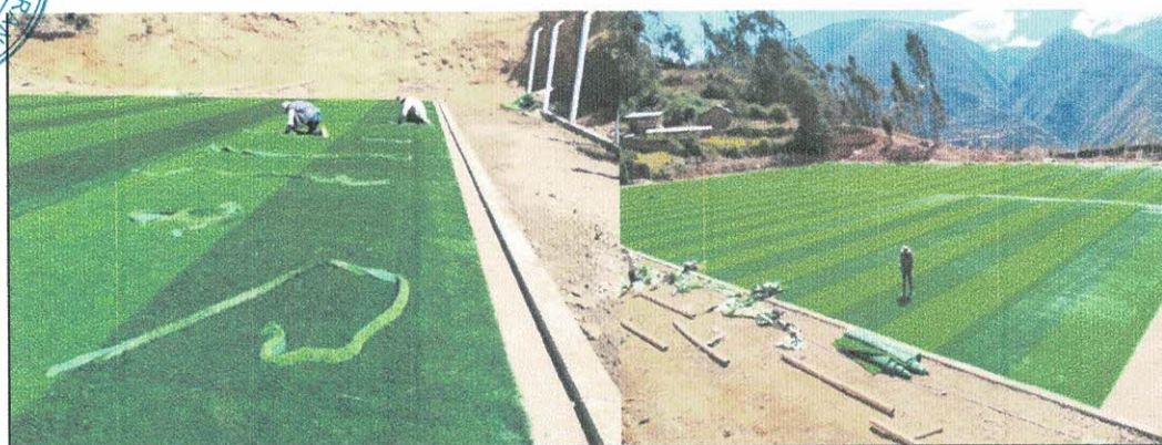
Imagen Referencial Del Extendido De Grass Sintético