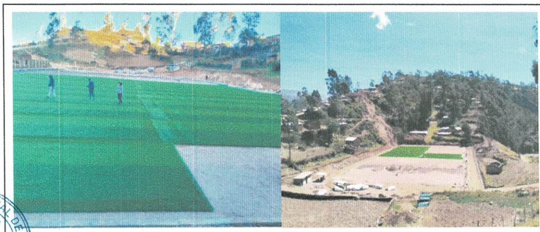
Imagen Referencial Del Extendido De Grass Sintético

Se dispondrán y extenderán paralelamente los rollos de gras sintético, asegurándose que todas las piezas presenten las fibras o hilos hacia una misma dirección. De no ser así, el reflejo del sol o cualquier tipo de luz mostrara una clara diferencia de color entre las piezas. Si se llegaran a mojar los rollos hay que exponerlos al sol antes de la instalación, (si es en exterior). No se puede iniciar la instalación con el Grass en escuadra. Se deberá refilar el excedente de base para poder tener una unión precisa