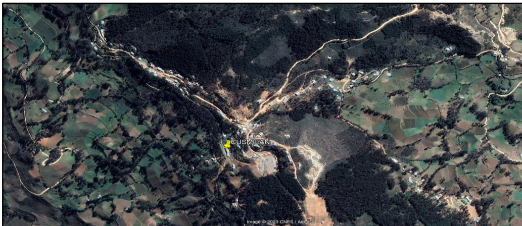
Ilustración 1.- Ubicación del caserío Cusmilán