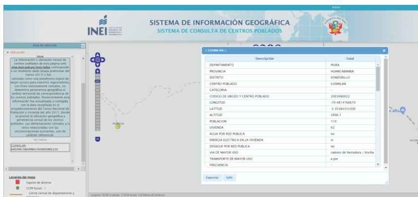
Imagen N° 01: Consulta de Ubigeo de centro poblado en data del INEI

Se deberá colocar el ubigeo de cada centro poblado del proyecto, según se muestra en la data del INEI. Para esto, se podrá acceder al sitio web: http://sige.inei.gob.pe/test/atlas/ .