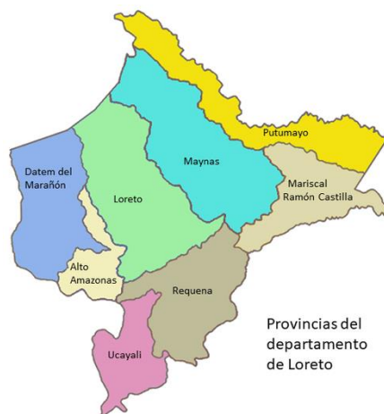
Fig. 2: Mapa Provincial de Loreto