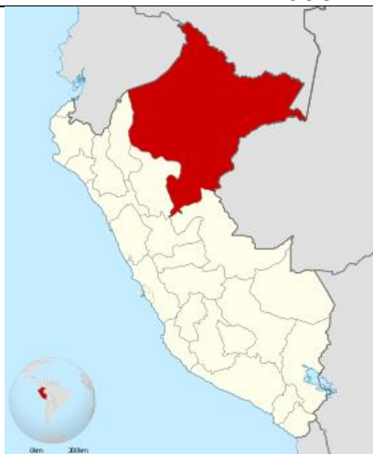
Fig. 1: Mapa Departamental del Perú - Loreto