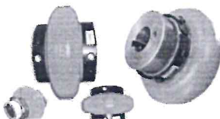
Imagen referencial 1. Acoplamiento flexible.