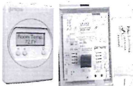
Imagen referencial: LCD T-Stat C4. Número de partes: 250052-100 - Parte posterior de la tarjeta.