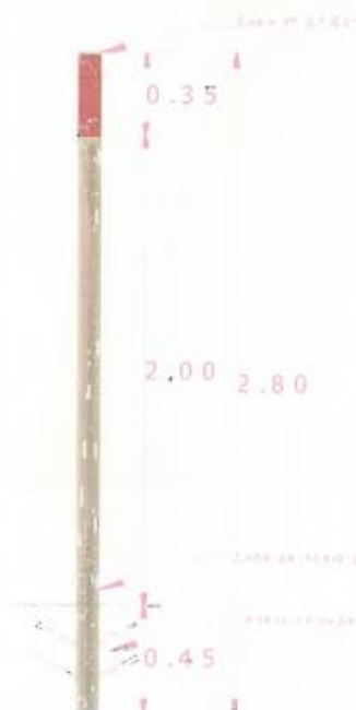
Imagen 2 (diseño de tubo 4")