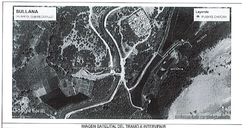
IMAGEN SATELITAL DEL TRAMO A INTERVENIR

IOARR: "REPARACIÓN DE PUENTE EN EL (LA) CHOCAN DEL CAMINO VECINAL R2006151 DE LA LOCALIDAD CHOCAN DEL DISTRITO DE QUERECOTILLO, PROVINCIA DE SULLANA, DEPARTAMENTO DE PIURA"