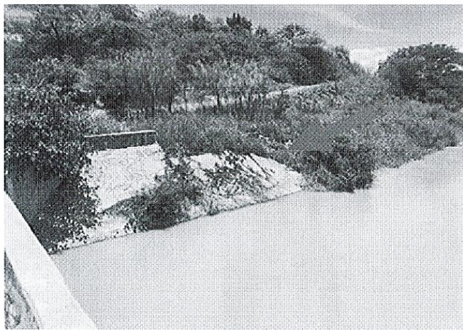
LOSAS EN CANAL DE ENTRADA A PUENTE