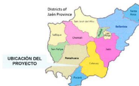
GRAFICO 03 Y 04: MAPA PROVINCIAL DE JAEN