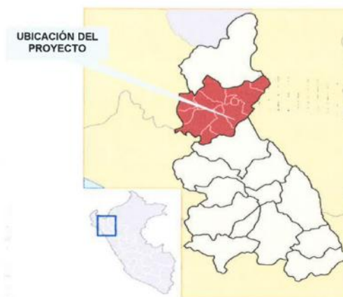
GRAFICO 02: MAPA REGIONAL DE CAJAMARCA.

PROVINCIA-JAEN-REGION-CAJAMARCA UNIDAD DE ESTUDIOS Y PROYECTOS