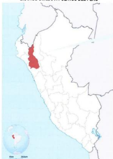
GRAFICO 01: MAPA POLÍTICO DEL PERÚ