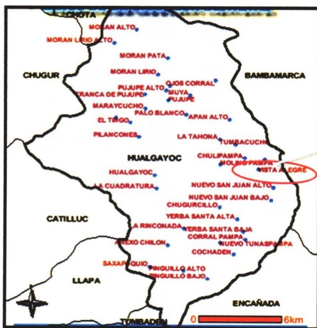
Gráfico N° 03 – Ubicación del Proyecto: Vista Alegre Bajo