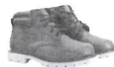
Botines cortos de Jebe