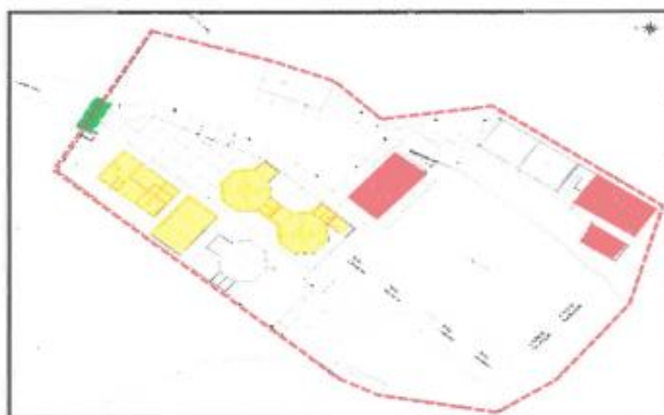
PLANTA GENERAL DEL PRIMER PISO