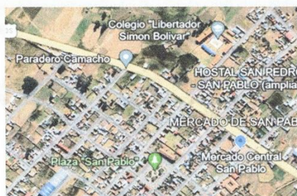
Imagen referencial de la ubicación:

El proveedor tendrá un plazo máximo de cinco (5) días calendario para la entrega según cronograma de los materiales requeridos, contados a partir del día siguiente de haber sido notificado con la orden de compra y/o firmado el contrato.