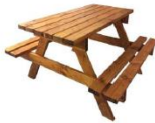
DISEÑO REFERENCIAL DE LAS MESAS TIPO CAMPING REQUERIDO POR PROMPERÚ