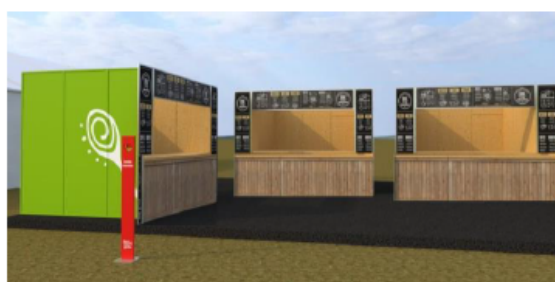
DISEÑO REFERENCIAL DEL STAND ARTESANÍAS REQUERIDO POR PROMPERÚ