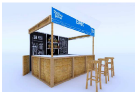
DISEÑO REFERENCIAL DEL STAND DE BARES REQUERIDO POR PROMPERÚ