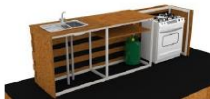
DISEÑO REFERENCIAL DE LA CLASE MAGISTRAL (SHOW COOKING) REQUERIDO POR PROMPERÚ