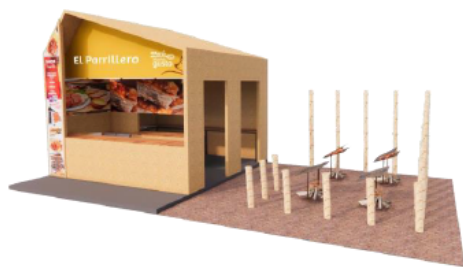
DISEÑO REFERENCIAL DEL STAND COCINAS DE CAMPO (HUMOS) REQUERIDO POR PROMPERÚ