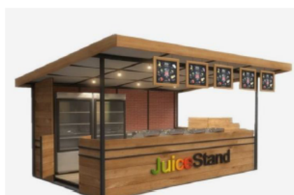
DISEÑO REFERENCIAL DEL STAND DE BEBIDAS NATURALES REQUERIDO POR PROMPERÚ