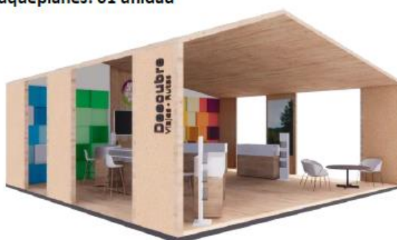
DISEÑO REFERENCIAL DEL STAND YTUQUEPLANES REQUERIDO POR PROMPERÚ