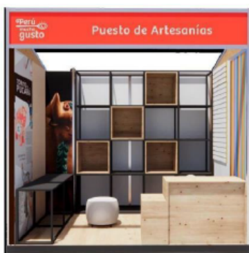
DISEÑO REFERENCIAL DEL STAND ARTESANÍAS REQUERIDO POR PROMPERÚ