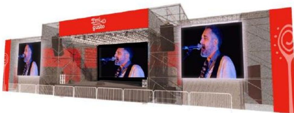
DISEÑO REFERENCIAL DEL ESCENARIO DE PRESENTACIONES MUSICALES REQUERIDO POR PROMPERÚ