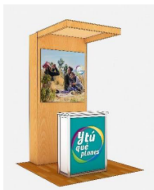
DISEÑO REFERENCIAL DEL MÓDULO DE TURISMO REQUERIDO POR PROMPERÚ