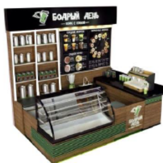
DISEÑO REFERENCIAL DEL STAND DE POSTRES REQUERIDO POR PROMPERÚ