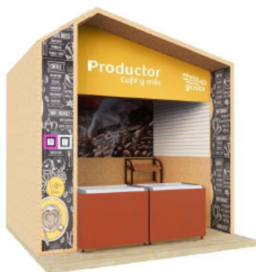
DISEÑO REFERENCIAL DEL STAND DE PRODUCTOS REQUERIDO POR PROMPERÚ