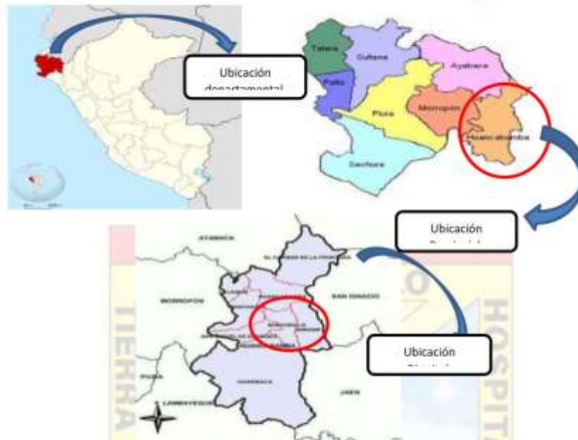
Imagen 02. Localización Macro del proyecto