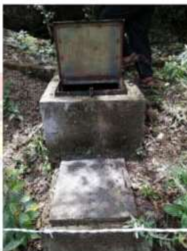
Imagen 06. Situación actual de la captación manantial "Carrizo"