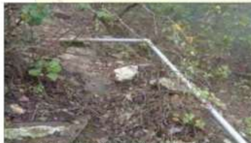
Imagen 08. Tubería PVC de la línea de conducción expuesta y en mal estado debido a su antigüedad y falta de mantenimiento.

El reservorio a la cual llega la tubería desde la captación, dicha estructura tiene forma circular, el cual tiene una capacidad de 10 m3 y se encuentra en mal estado, no cuenta con sistema de cloración funcionando, por lo que el agua no es tratada de manera adecuada. Adicionalmente, es preciso indicar que tampoco cuenta con cerco perimétrico que asegure la estructura.