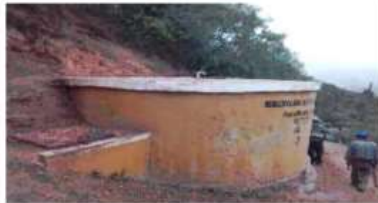
Imagen 09. Reservorio existente de 10 m³.