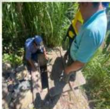
Imagen 07. Situación actual de la captación manantial "La Palma", con caudal aforado de 0.13 l/s