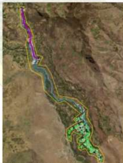
Imagen 03. Área de influencia del caserio Nuevo Bolognesi