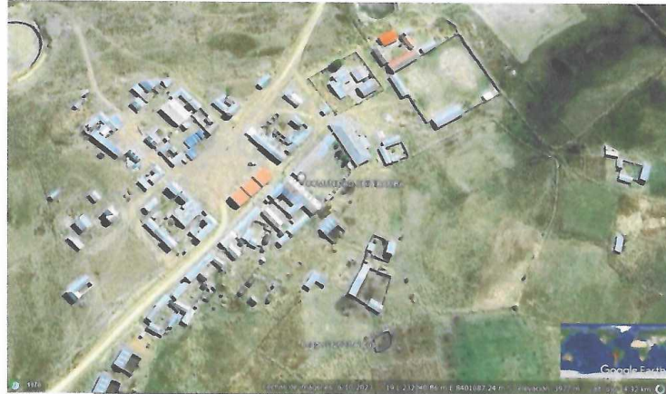
IMAGEN N° 1: MICRO LOCALIZACIÓN DEL PROYECTO