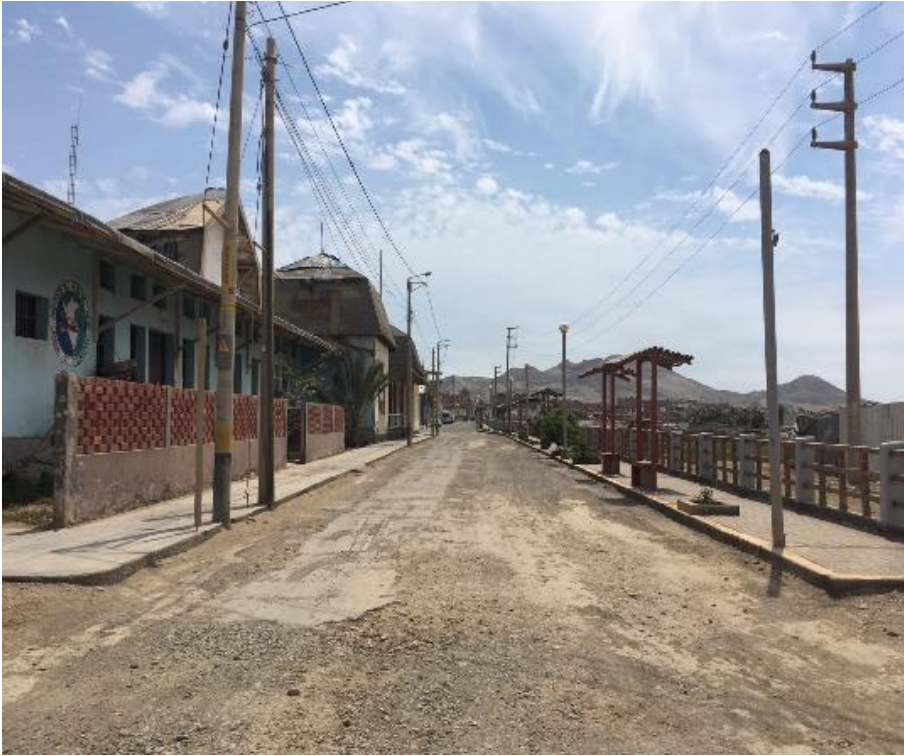
Figura N°4: Ubicación geográfica del proyecto.

La presente contratación se rige por el Sistema esquema mixto de Tarifas y A Suma Alzada: