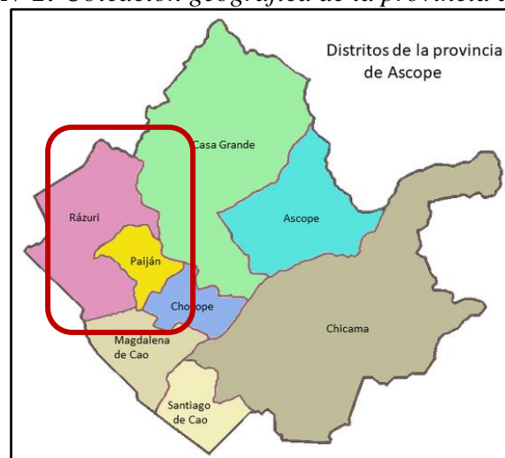
Figura N°3: Ubicación geográfica del distrito de Rázuri.

Centro Poblado: Puerto de Malabrigo Distrito: Rázuri