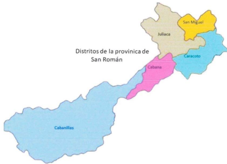
IMAGEN N°04: UBICACIÓN DEL PROYECTO