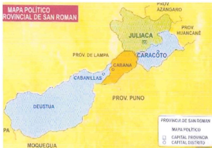
IMAGEN N°03: UBICACIÓN DISTRITAL