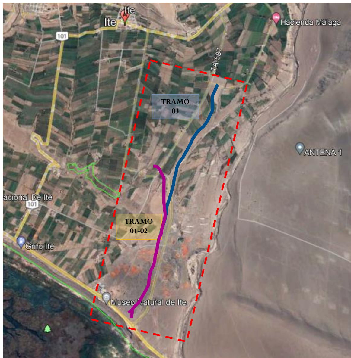
Imagen N°02 Esquema de Micro localización: Ubicación Distrital