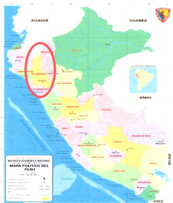
Gráfico 01: Ubicación del Departamento de Cajamarca