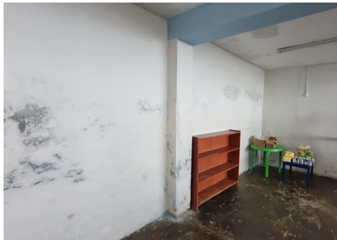
Imagen N°02: Luminarias dañadas.