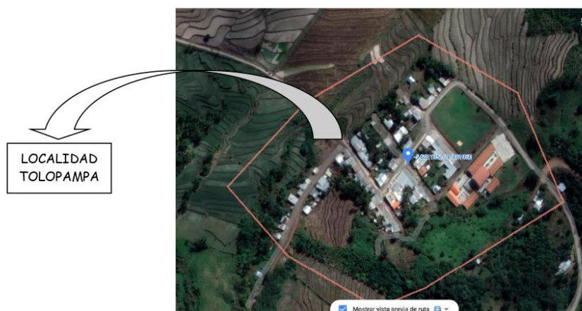
MAPA 3: LOCALIDAD TOLOPAMPA