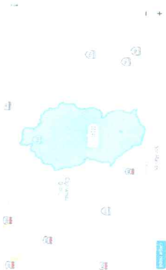
Ilustración 3 Ubicación satelital del proyecto