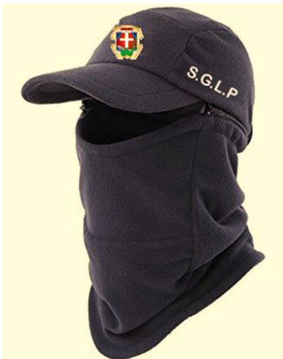
IMAGEN REFERENCIAL (COLOR GUINDA)

“GORRO TIPO ARABE PARA EL PERSONAL DE RECOLECCION DE RESIDUOS SOLIDOS DE LA MUNICIPALIDAD DE SAN JUAN BAUTISTA”