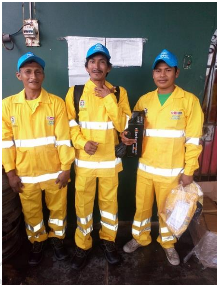
IMAGEN REFERENCIAL (COLOR VERDE)