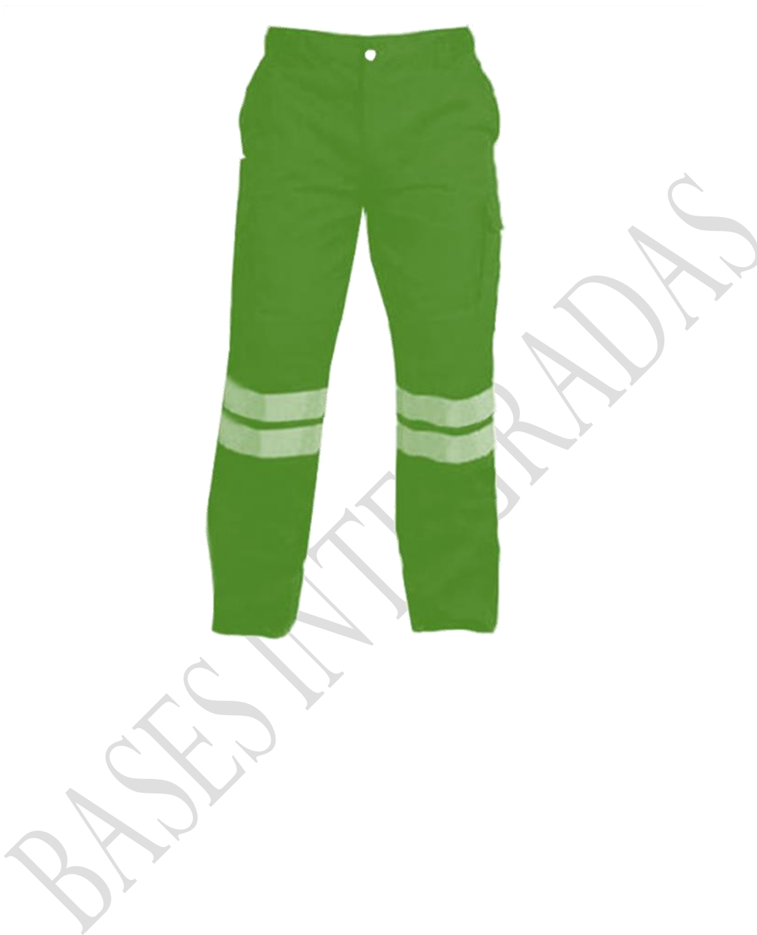
IMAGEN REFERENCIAL (COLOR GRIS CON BORDE VERDE)