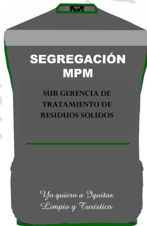
IMAGEN REFERENCIAL (COLOR GUINGA CON FRANJAS NEGRA)