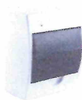
Tablero adosable 6 polos TKI 108209