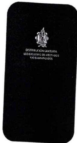
IMAGEN REFERENCIA DEL COLCHÓN: