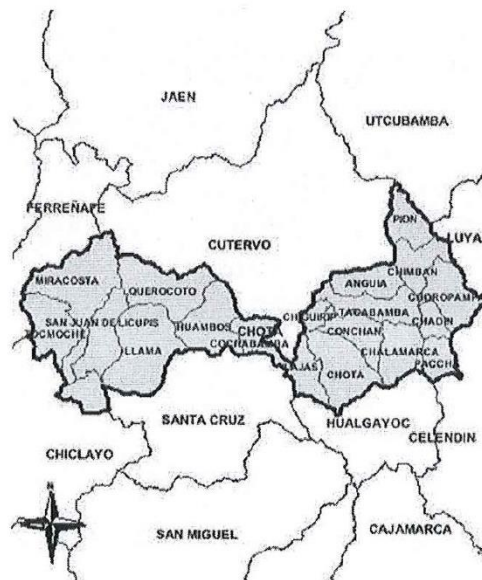
MAPA N° 03. Ubicación geográfica del distrito de Chota