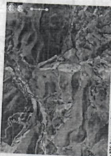
Imagen N°4: Imagen satelital -Acceso a la I.E.P divino niño e Jesús.