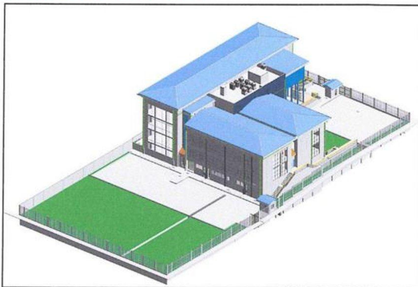
PROYECTO A EJECUTAR