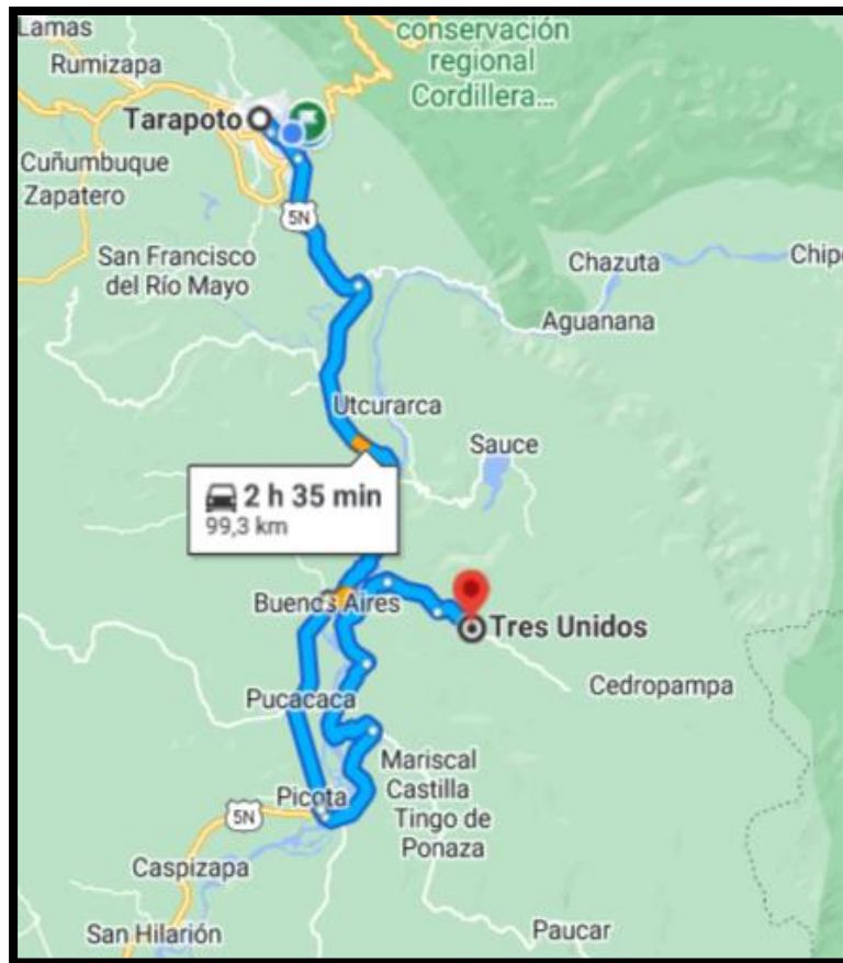
Imagen N° 1 Vías de Acceso al Proyecto.