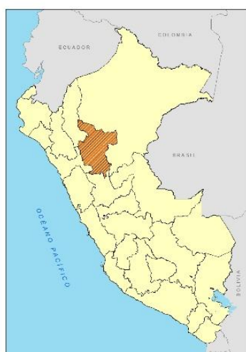
Mapa 1: Perú

ESTE : 0287138.234 NORTE : 9324528.022 ALTITUD : 1065.426