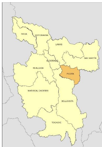
Mapa 2: San Martín