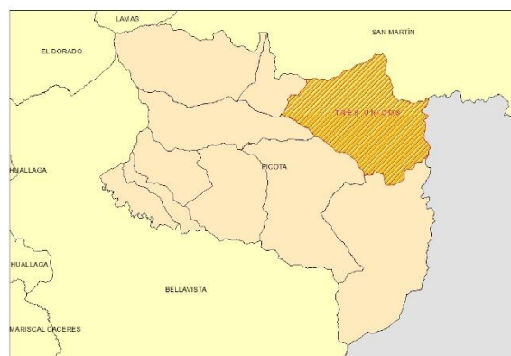
Mapa 3: Picota