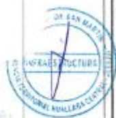
Tabla de Requisitos de la Contratación de nuestra institución y de la Comisión de Selección Simplificada N°08-2024