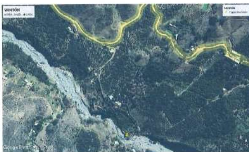
Vista del Área de Intervención del Proyecto