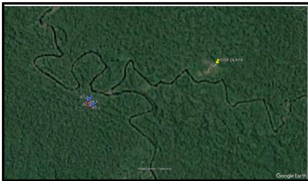
GRÁFICO N° 04: UBICACIÓN GEOGRAFICA SATELITAL DEL PROYECTO