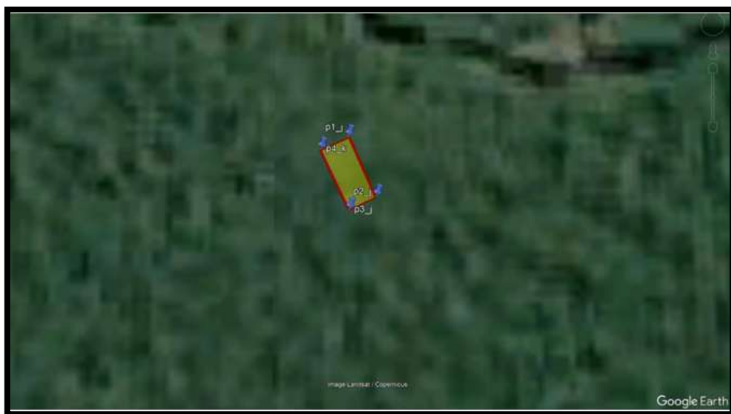
GRÁFICO N° 05: UBICACIÓN GEOGRAFICA SATELITAL DEL PROYECTO