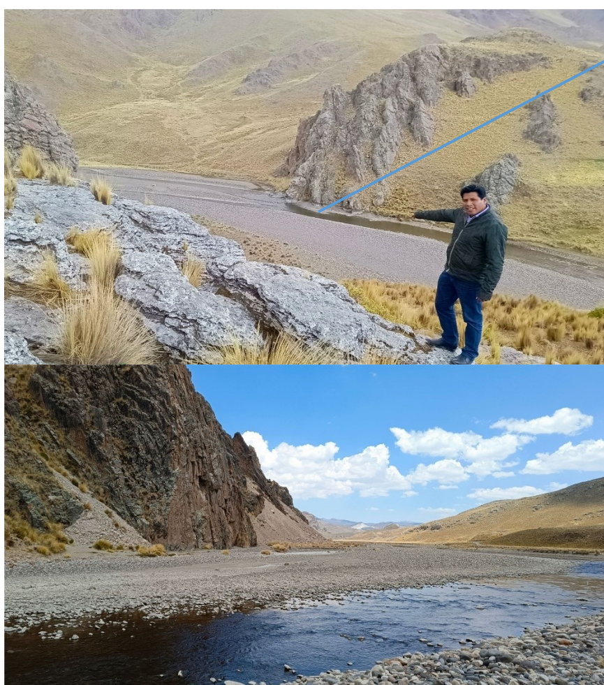
FUENTE DE AGUA

El punto de captación de la fuente de agua es la cuenca y sub cuencas del rio llave, a partir de ahí se deriva sus aguas a través de la infraestructura de conducción precaria.